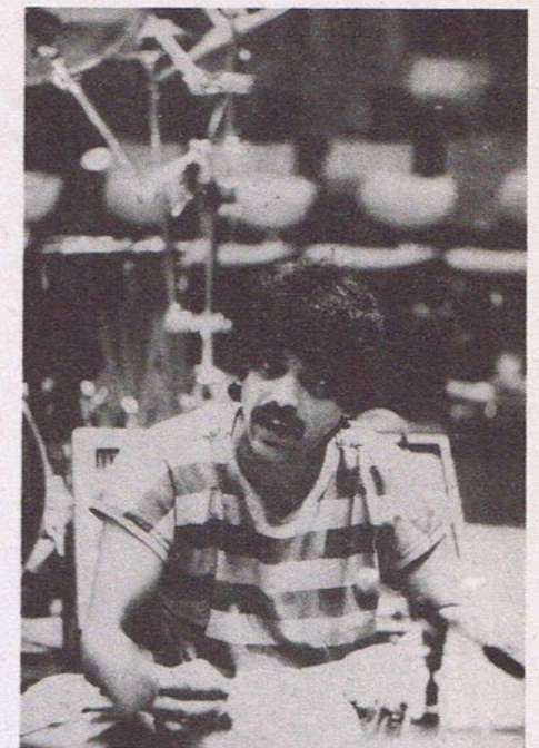
PHILIP CATHERINE: Gitarre

Ein Trio mit einigen der illustren Stars der heutigen Jazz-Musik hat sich im UTOPIA angesagt. Da ist einmal TRILOK GURTU , Inder, der seit seiner Emigration nach New York im Jahre 1977 mit Jack DeJohnette, Charlie Mariano, Don Cherry, Gil Evans, Randy Brecker u.v.a. zusammengewirkt hat. Seit 1985 ist er Mitglied von RALPH TOWNER'S Band OREGON, 1988 war er u.a. mit JOHN