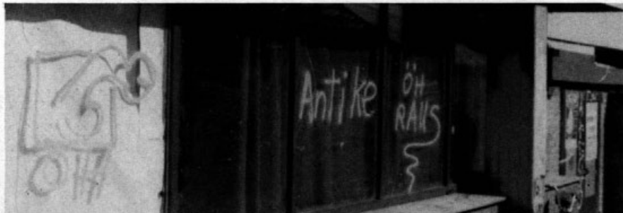
KOMM-Seitenansicht: Verhältnis ÖH-KOMM eindeutig

Auf gut Deutsch: bei Schwierigkeiten konnte man sich in letzter Konsequenz hinter dem Rücken des Vorsitzenden verstecken, weil man ja selbst keine Verantwortung zu tragen hat.