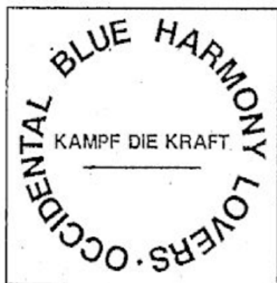
O.B.H.L. - Kampf die Kraft