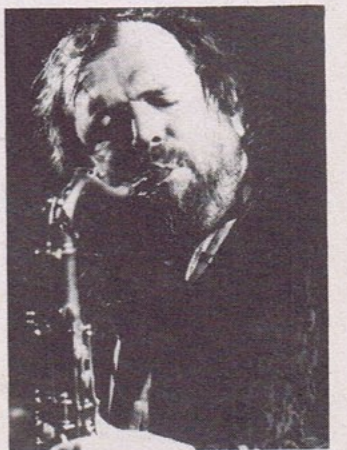
WILLEM BREUKER Saxophon